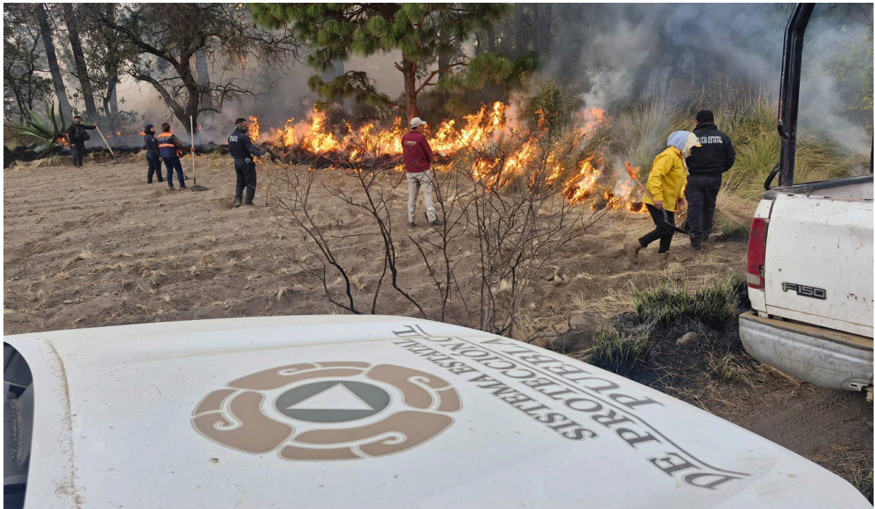
Las quemas agrícolas y provocados son la mayor cantidad de siniestros que se han presentado en Puebla.