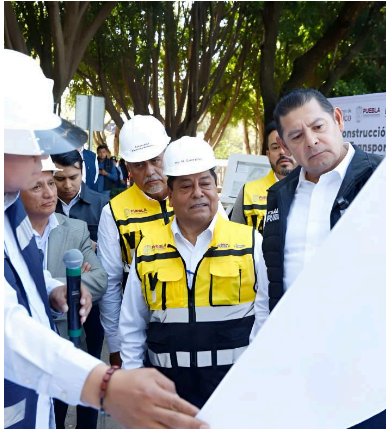
El tribunal a cargo, consideró insuficientes los elementos para suspender el proyecto de movilidad en la ciudad de Puebla.

El contraste entre la encuesta y la conversación en redes evidencia una disputa de narrativa más que un rechazo generalizado. Mientras los estudios demoscópicos —con metodologías estructuradas— reflejan opiniones más estables y matizadas, el ecosistema digital tiende a polarizar y simplificar el debate, privilegiando mensajes negativos o alarmistas.