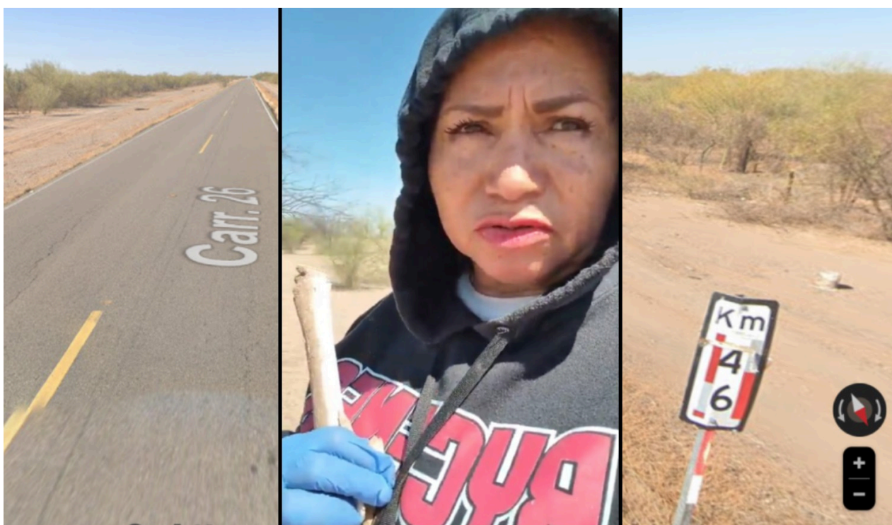
El hallazgo fue realizado luego de que uno de los responsables del crimen informó sobre el sitio probable.