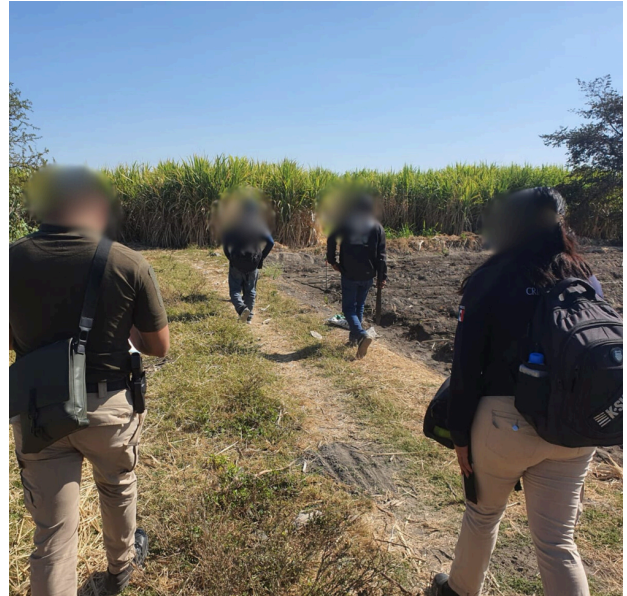
Brigada de búsqueda de personas.

El subsecretario de Derechos Humanos Arturo Medina Padilla explicó que antes de la reforma legal de 2025 no se exigían datos básicos al momento de generar un reporte. El resultado es un archivo con miles de entradas que hoy resultan prácticamente inutilizables para tareas de búsqueda.