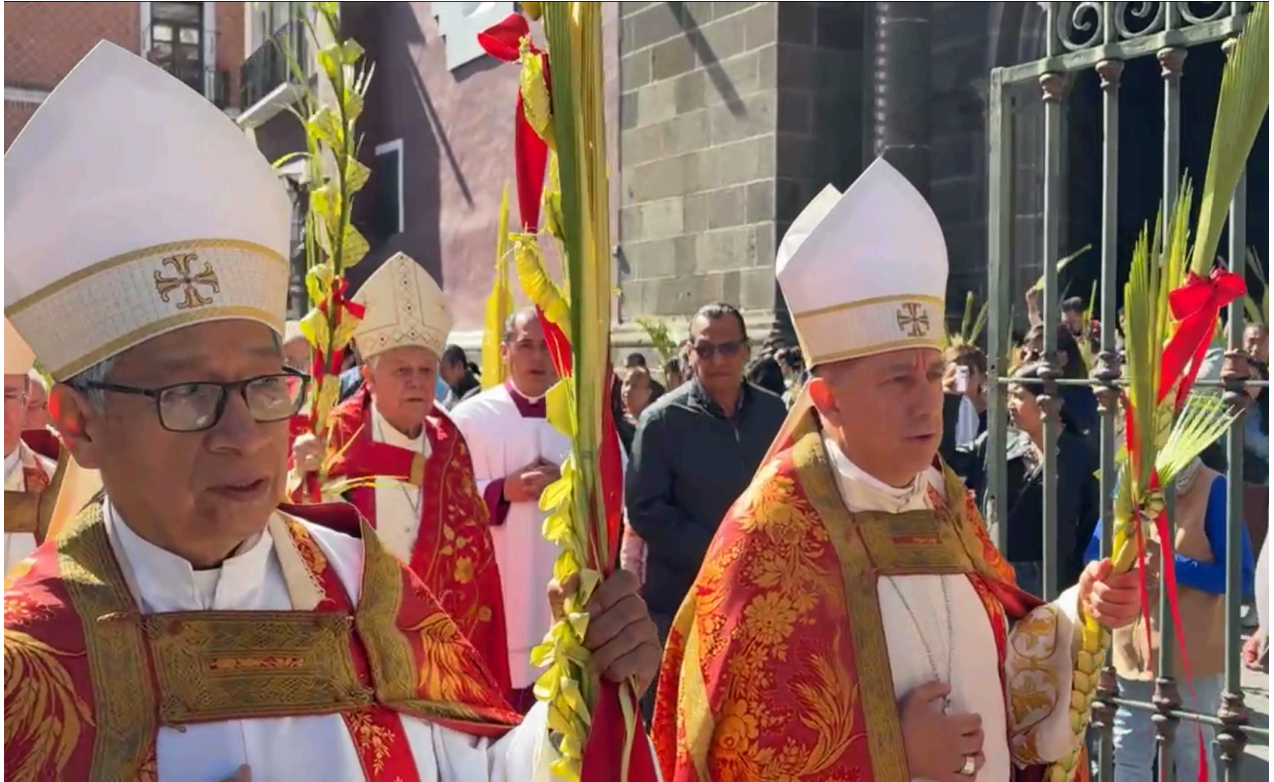
Cientos de feligreses se congregaron para conmemorar la entrada triunfal de Jesús en Jerusalén.