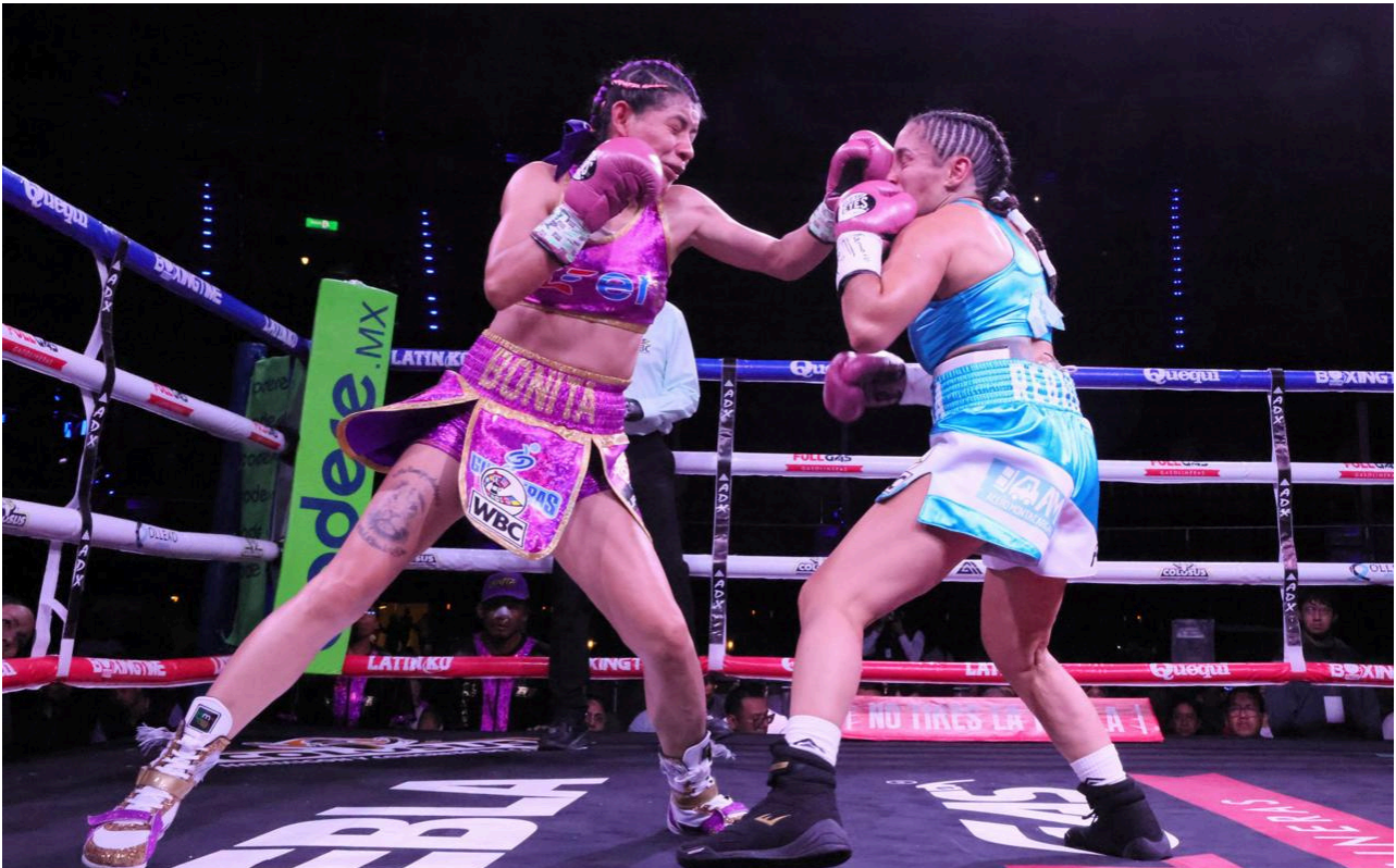
Por decisión unánime de los jueces, la poblana se quedó con el título interino del Consejo Mundial de Boxeo.