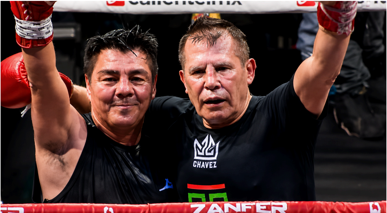
Los campeones y leyendas del boxeo mexicano dieron una espectacular pelea en el marco de la Feria de Puebla 2026.