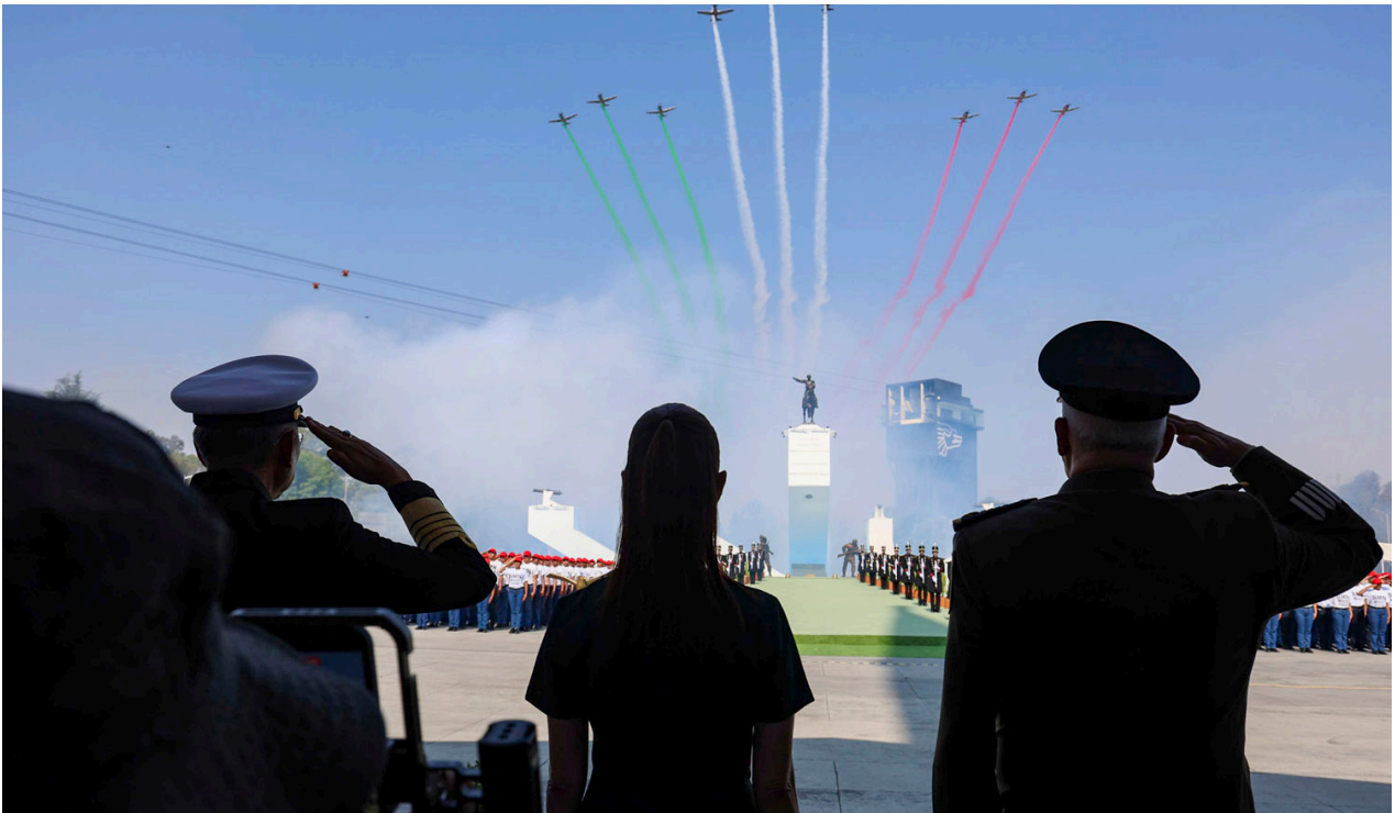
La presidenta lanzó un mensaje de unidad y defensa de la soberanía nacional ante amagos extranjeros.