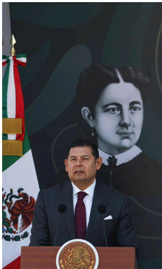
Alejandro Armenta respaldó a la presidenta.

Señaló que el 5 de Mayo no solo es una conmemoración militar, se trata de una lección sobre el valor de la soberanía, la cual toma vigencia para aquellas voces que actualmente creen que los problemas de México se resuelven desde el extranjero.