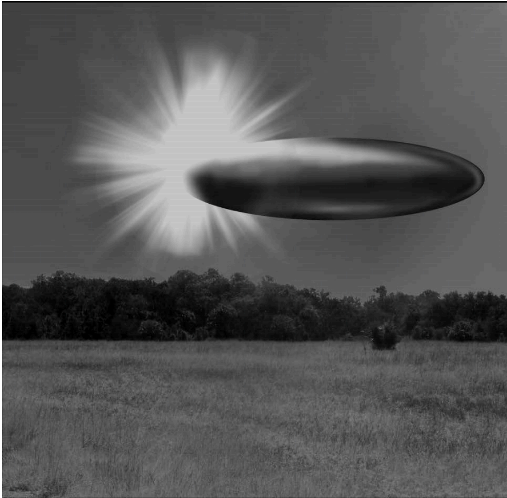
Avistamiento del FBI en Septiembre 2023 - Boceto compuesto. Imagen: FBI

Uno de los archivos más relevantes retomados en la nueva liberación corresponde al llamado caso "Tic Tac", ocurrido en 2004 frente a las costas de California.