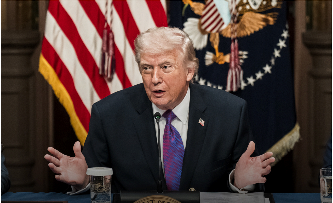
La declaración fue realizada durante un acto en la Casa Blanca.