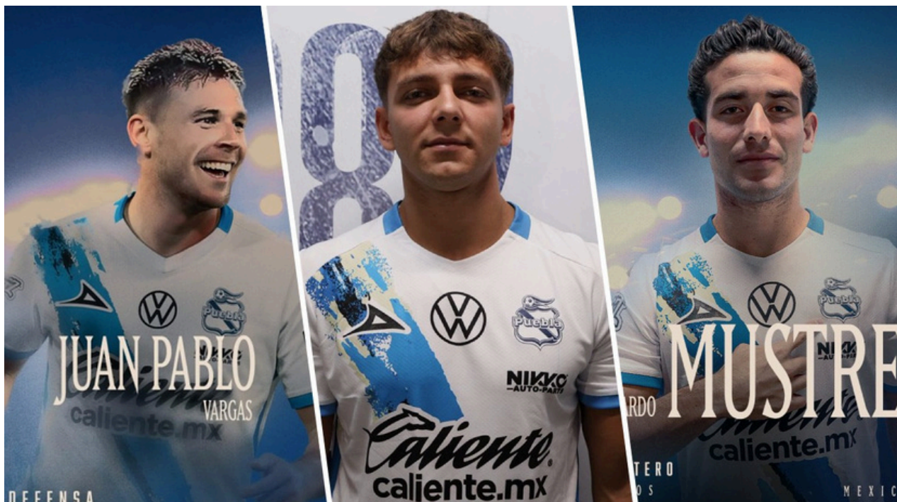
Los nuevos jugadores del Puebla arrancan con entrenamientos de cara al Torneo Clausura de este año.