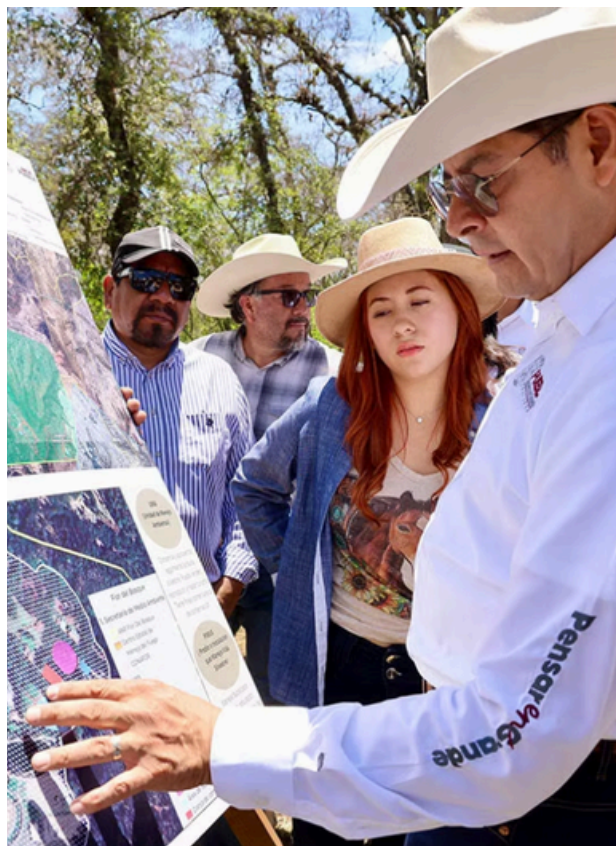
El proyecto de Flor del Bosque atrajo la atención.

La atención centrada en personajes públicos da cuenta de la importancia que para nuestros lectores representan las historias humanas y la forma de recordar a quienes dejan un legado intangible en las comunidades.