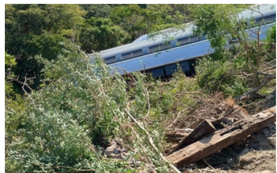
Los pasajeros de vagones 1 y 2, entre más afectados.

Para brindar mayor información y orientación a los familiares de las personas afectadas, la Secretaría de Gobernación pone a disposición el siguiente número para atención a víctimas: 55 22 30 21 06.