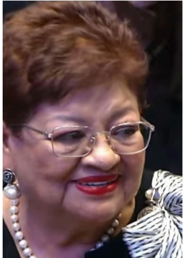
Ernestina Godoy, fiscal general de la República.

A los cuestionamientos se suman los descarrilamientos registrados en la Línea Z, particularmente en el tramo de Nizanda, hechos que detonaron exigencias de legisladores de oposición para suspender operaciones y revisar a fondo la calidad de la obra.