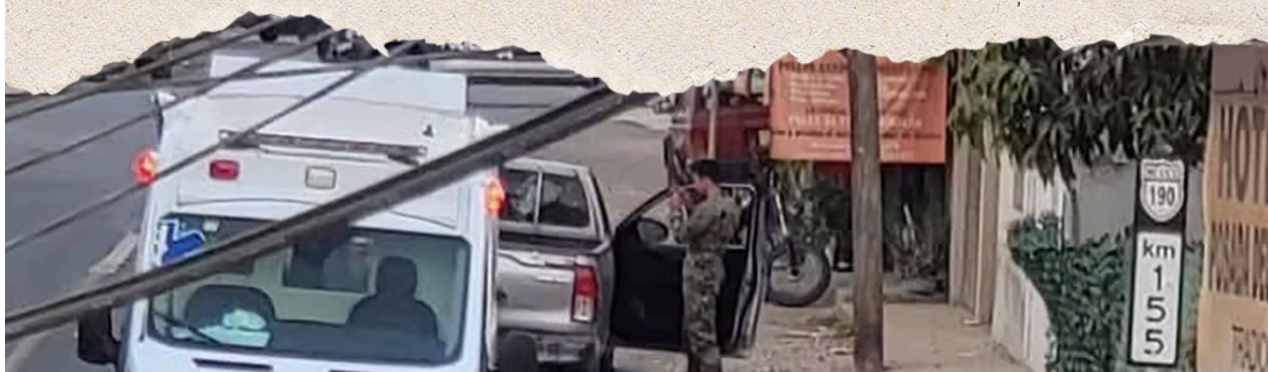
El 2025 arrancó con un ataque armado en contra de elementos de la Marina en Acatlán de Osorio.